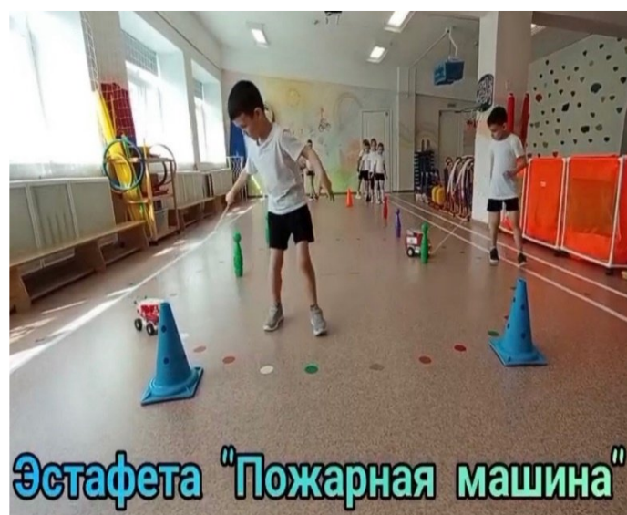
Эстафета "Пожарная машина"