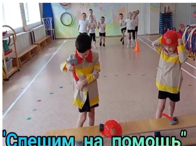
"Спешим на помощь"